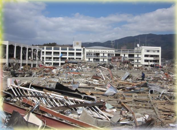
2011/6 陸前高田市役所前