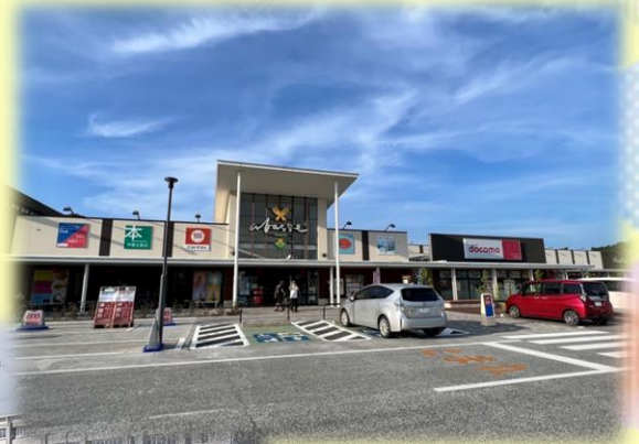
2022/7 商業施設「アバッセ」