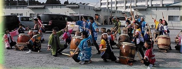
2011/9 高田高校仮設住宅前での演奏交流